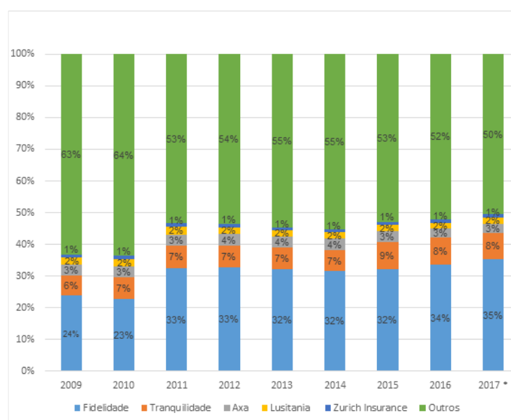
Gráfico n.º 3 – Estrutura do mercado de seguro de Saúde (2009 – 2017)